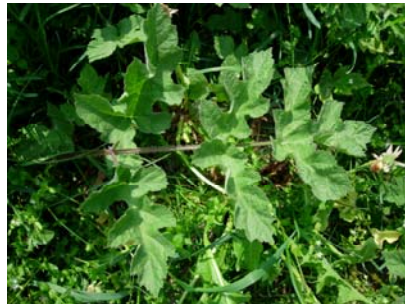
≠ Heracleum sphondylium

Feuilles découpées jusqu'à la nervure → semblent composées